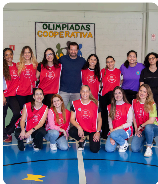
Instituto Devolver: ação de Dia das Crianças + doação de livros infantis