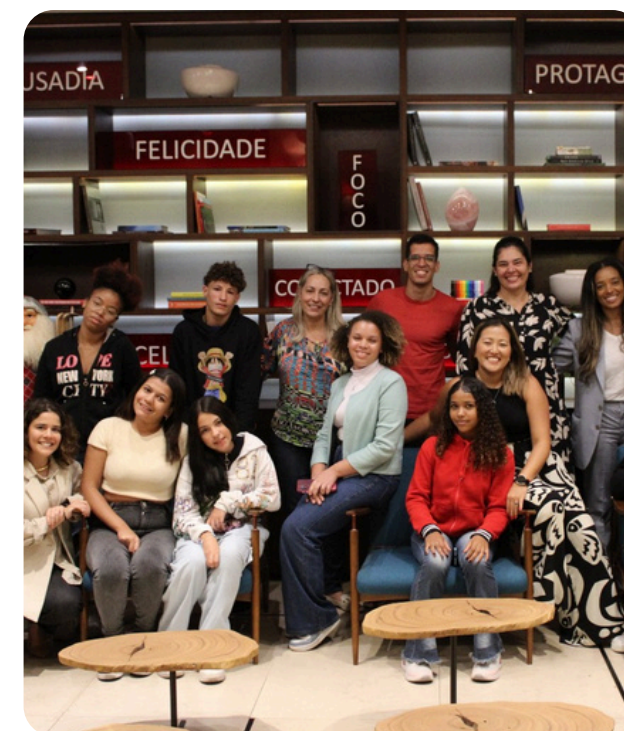
Instituto Devolver: roda de conversa com jovens