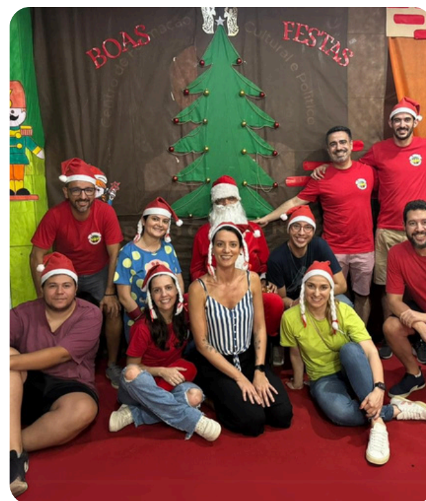
GFC Solidário: ação de Natal