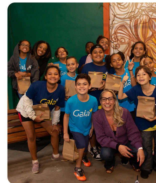
Gaia+: apoio ao projeto "Meu Primeiro Livro" com patrocínio e sessão de autógrafos